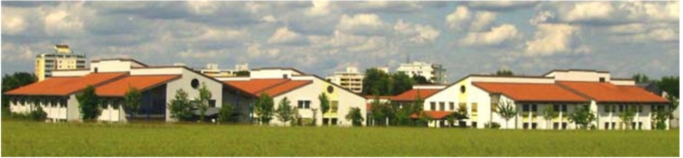
Abbildung: Bezirkskrankenhaus Augsburg